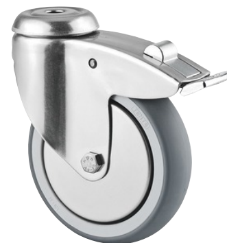
La foto puede diferir del producto original